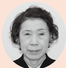
美祢市社会福祉協議会