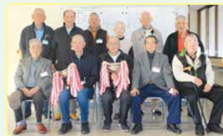
令和7年度将棋大会(11月28日開催)

将棋を指しながら、頭の体操を しませんか？ 仲間づくりにもぴったりです。 興味のある方は、美祢市社協ま でお気軽にお問い合わせしてくださ い。