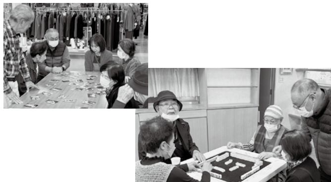
市内での地域住民の交流の様子