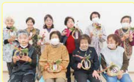
ぶちボラデイ(しめ縄づくり)