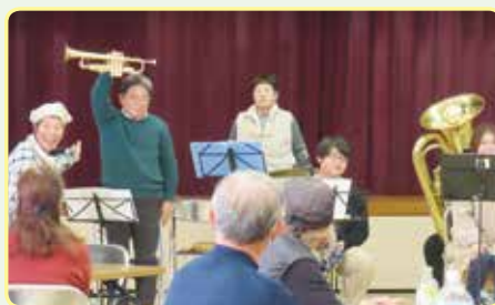
ふれあい会食会(秋芳町岩永)