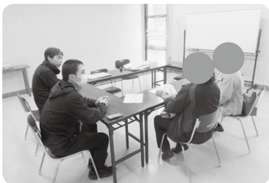
空き家関連相談中の様子