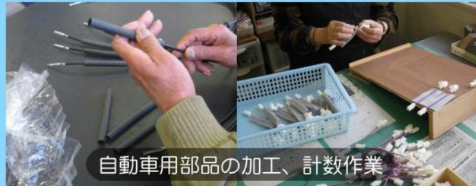
自動車用部品の加工、計数作業