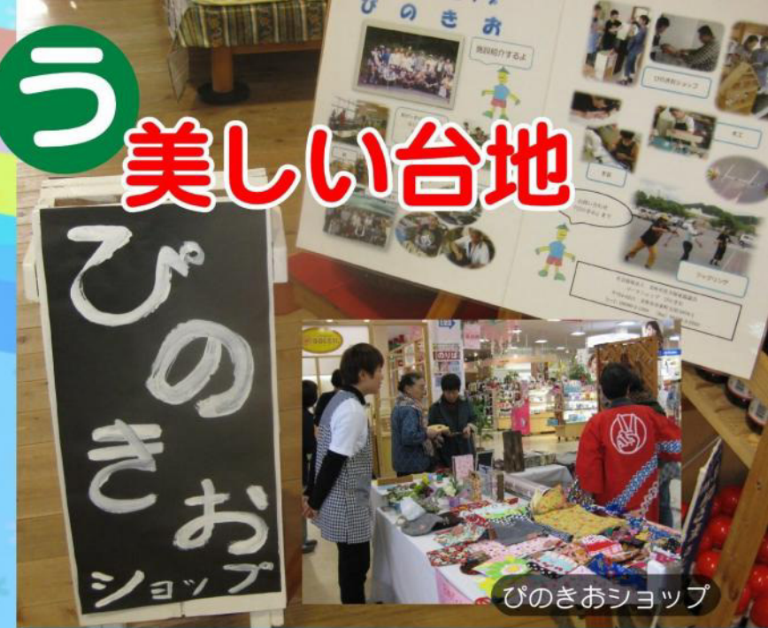
ぴのきおショップ