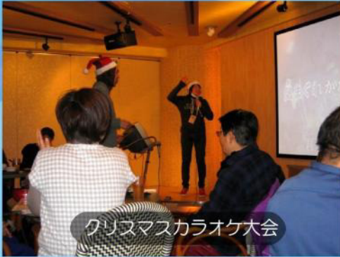
クリスマスカラオケ大会